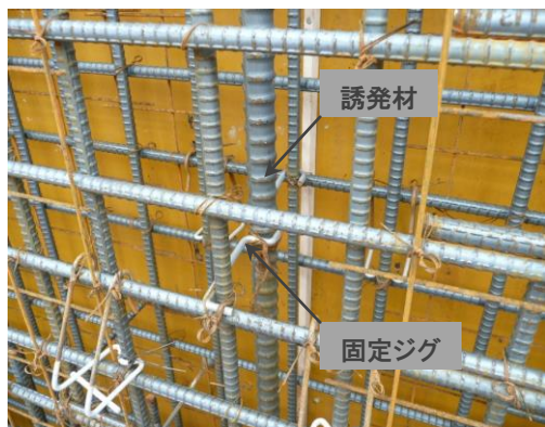
写真1 CCB-NAC工法の施工例（戸境壁）