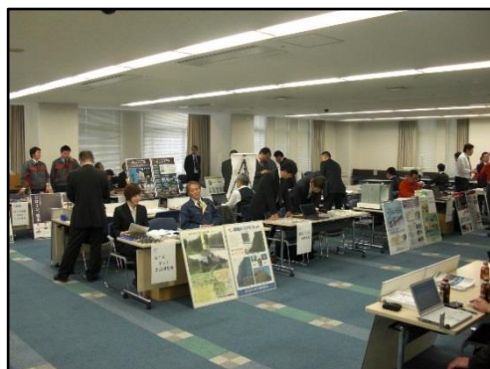
写真3 ブース展示会場