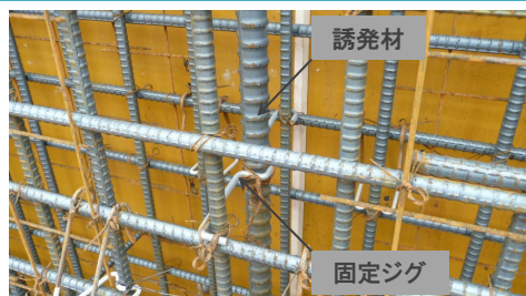
誘発材の固定状況